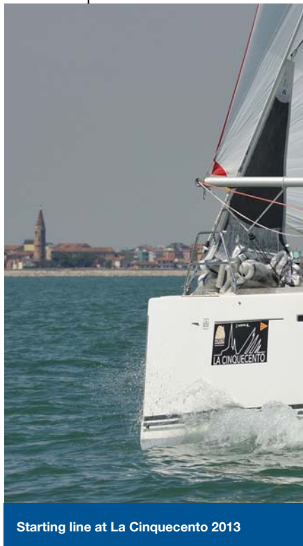
Starting line at La Cinquecento 2013

Except in an emergency, a boat shall neither make radio transmissions while racing nor receive radio communications not available to all boats. This restriction also applies to mobile telephones.