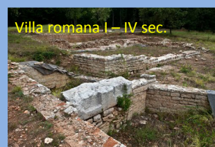
Villa romana I – IV sec.