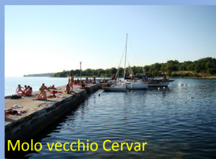
Molo vecchio Cervar