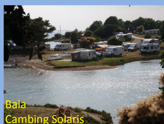
Baia Cambing Solaris