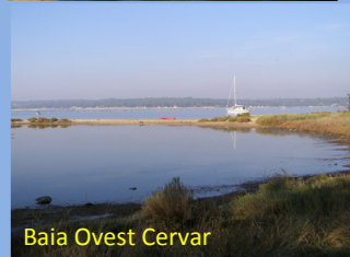
Baia Ovest Cervar